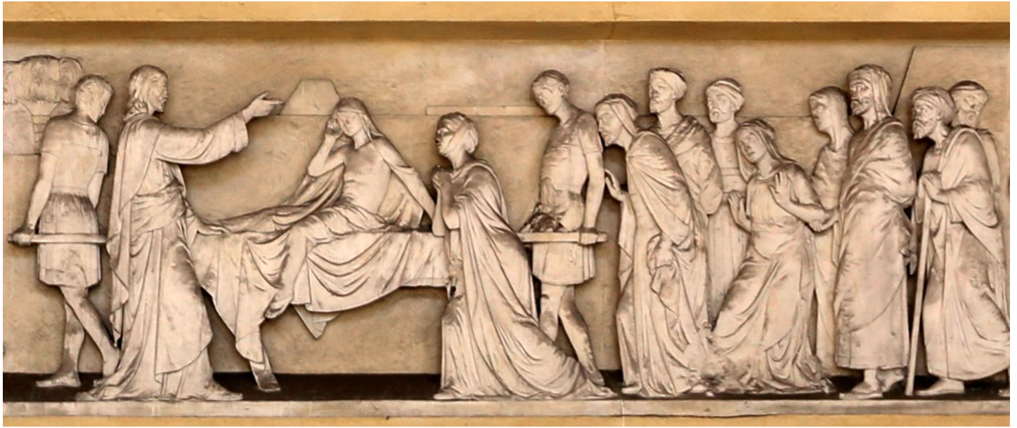
Il figlio della vedova di Nain